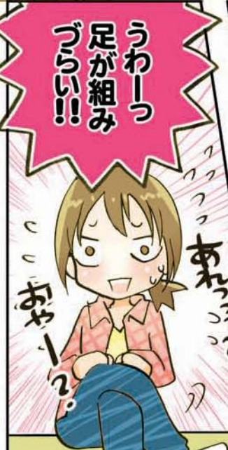
骨盤がゆがんでいた証